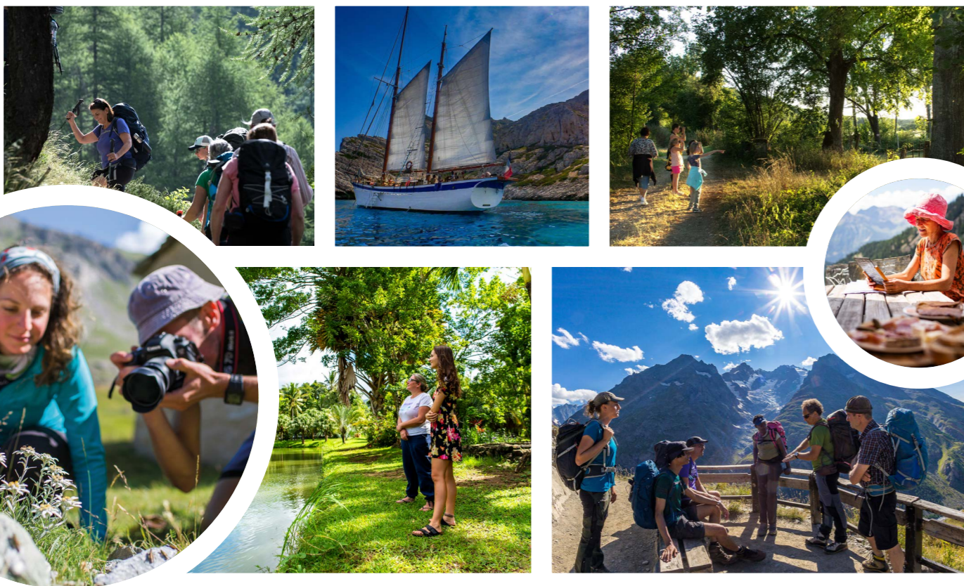
De haut en bas et de gauche à droite : Sortie avec le bureau des guides de Tinée // Croisière voile au cœur des Calanques // Animation avec Les Sentiers de la Belette // Tour d'Entre-Deux-Eaux // Parc aquacole // Séjour Refuges sentinelles // Restaurant L'Estiva